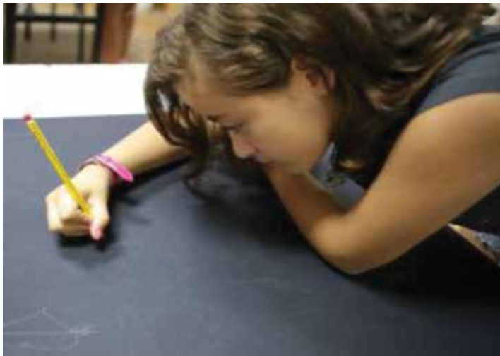
إحدى أهم الورش الفنية القائمة على تحليل رسوم ورموز الأطفال ودلالاتها

ولا شك أنها من الورش ذات الطبيعة الخاصة والتميز التي تعقد بالتعاون مع