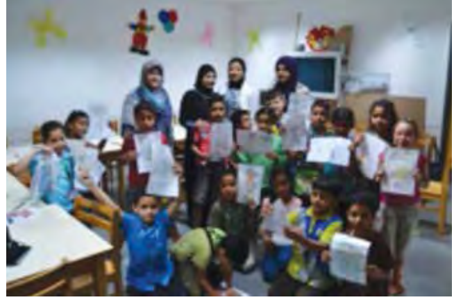
صور توضح فخر واعتزاز الأطفال بإنتاجهم الفني

بالإضافة إلى إتاحة فرص عمل للخريجين. ٤- أن تصبح جميع الفنون الإبداعية تحت مظلة التربية الفنية وليس فقط الفنون التشكيلية. ٥- إقامة معارض لبيع الأعمال الفنية المميزة من منتجات الأطفال؛ وذلك لتشجيعهم.