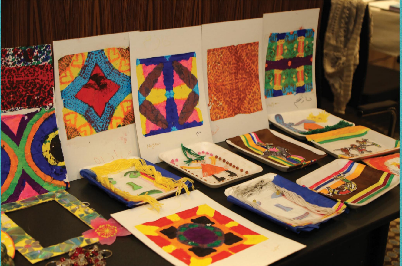
منتجات فنية لأطفال مشروع «أنا اخترت الأمل» الذي ينفذه المجلس العربي للطفولة والتنمية بالتعاون مع وزارة التضامن الاجتماعي المصرية في مؤسسة دور التربية بالجيزة. - للمزيد: www.arabccd.org