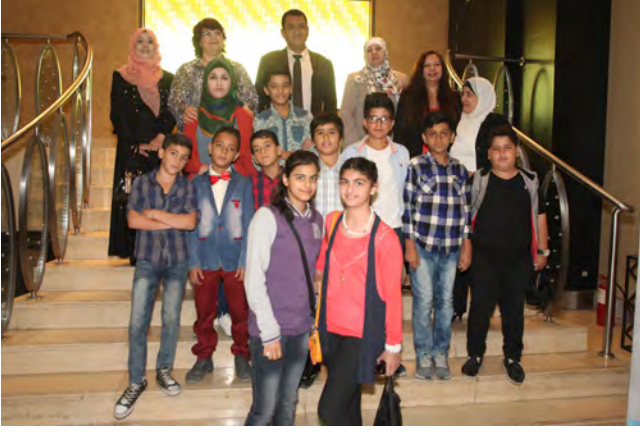
أطفال برلمان مركز الأمير سلمى بنت عبد الله الثقافي