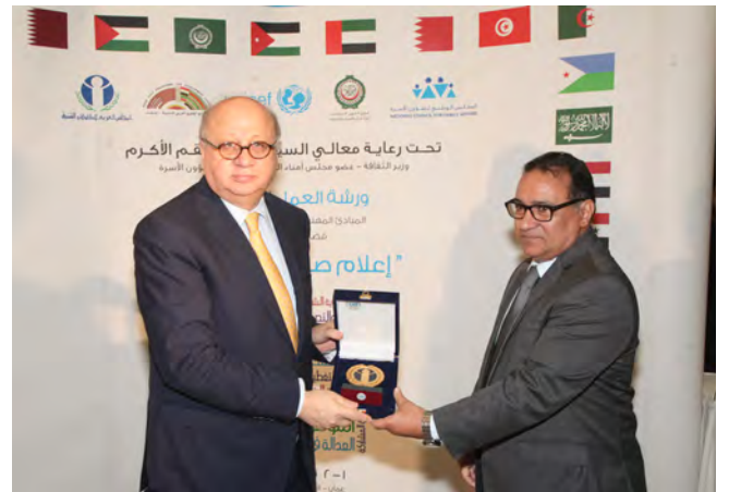
تسليم درع المجلس العربي للطفولة والتنمية لمعالي وزير الثقافة الأردني

وقد أعلن المشاركون في ختام الورشة التوافق والالتزام بالمبادئ والمعايير المهنية لمعالجة الإعلام قضايا حقوق الطفل، وأوصوا بتفعيل ومراجعة القوانين الوطنية ذات الصلة بالطفولة، ومواءمتها مع المعايير الدولية لحقوق الطفل، والتأكيد على أهمية وضع سياسة إعلامية موحدة تجاه قضايا حقوق الطفل، والاستمرار في عقد ورش العمل والحلقات النقاشية والدورات التدريبية للإعلاميين على المستوى الوطني والإقليمي، والاهتمام بالتربية الإعلامية بين الأطفال والأسر، ودعوة المجالس المختصة بالإعلام إلى تفعيل دورها في عملية الرصد والمتابعة والتحليل والمحاسبة تجاه الخروقات المهنية في قضايا الطفولة، ودعم مشاركة الأطفال في إعداد وبت البرامج الإعلامية المقدمة لهم، والدعوة إلى التشبيك بين الإعلاميين المناصرين لقضايا حقوق الطفل بما يساهم في تبادل المعلومات والخبرات، وتفعيل شبكة الإعلاميين الأردنيين أصدقاء الطفولة بالتنسيق مع المجلس الوطني لشؤون الأسرة.