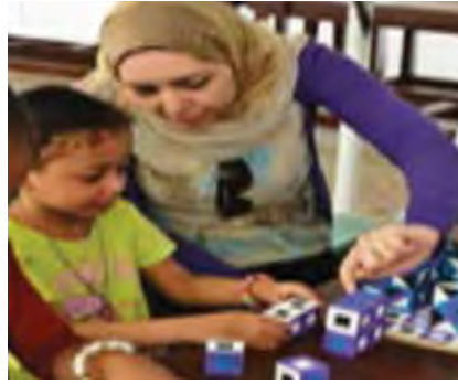
تنمية مهارات التفكير العليا لدى الأطفال من خلال اللعب

إن حق تعليم الفن بشكل عام والتربية الفنية بشكل خاص لطفل الروضة يسمح للطفل (بالاستمتاع - الاسترخاء - الرضا - الإنجاز والإبداع - النمو عقلياً ونمو الإدراك البصري لديه ودعم الخبرات الحسية)، فالنشاط الفني يحقق نمواً في شخصية الطفل وزيادة في الاتزان النفسي له وثقة بذاته وإنجازاته لما تفجره الممارسة الفنية من طاقات ابتكارية، فالتشكيل بالعجين والرسم والطباعة وغيرها من الأنشطة الفنية المختلفة توفر للطفل فرصاً عديدة للتأزر البصري والحسي، وتفحص الأجزاء ورؤية العلاقات في الحجم والشكل. لا شك أن كل هذا يشكل جزءاً مهماً في تعلم الأطفال. ويعتبر الفن وسيلة من وسائل النمو الاجتماعي يعلم الطفل الضبط الذاتي والتكيف مع حاجاته واهتمامات الجماعة واحتياجاتهم.